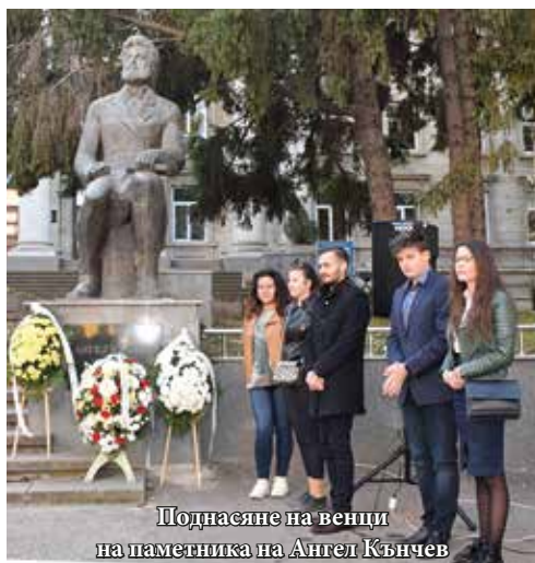
Поднасяне на венци на паметника на Ангел Кънчев

Денят започна с поднасянето на венци на паметника на Ангел Кънчев пред сградата на Ректората. Освен от името на академичната общност, венци бяха положени и от името на областния управител на Област Видин Албена Георгиева и кмета на Община Видин инж. Огнян Ценков. В словото си ректорът на