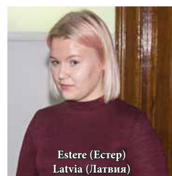
Estere (Естер) Latvia (Латвия)