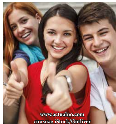
www.actualno.com снимка: iStock/Gutliver