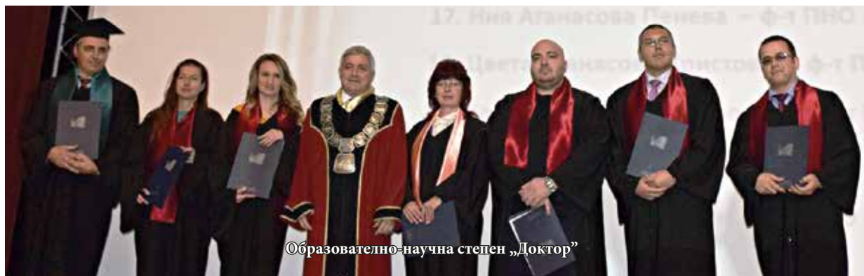
Образователно-научна степен „Доктор“