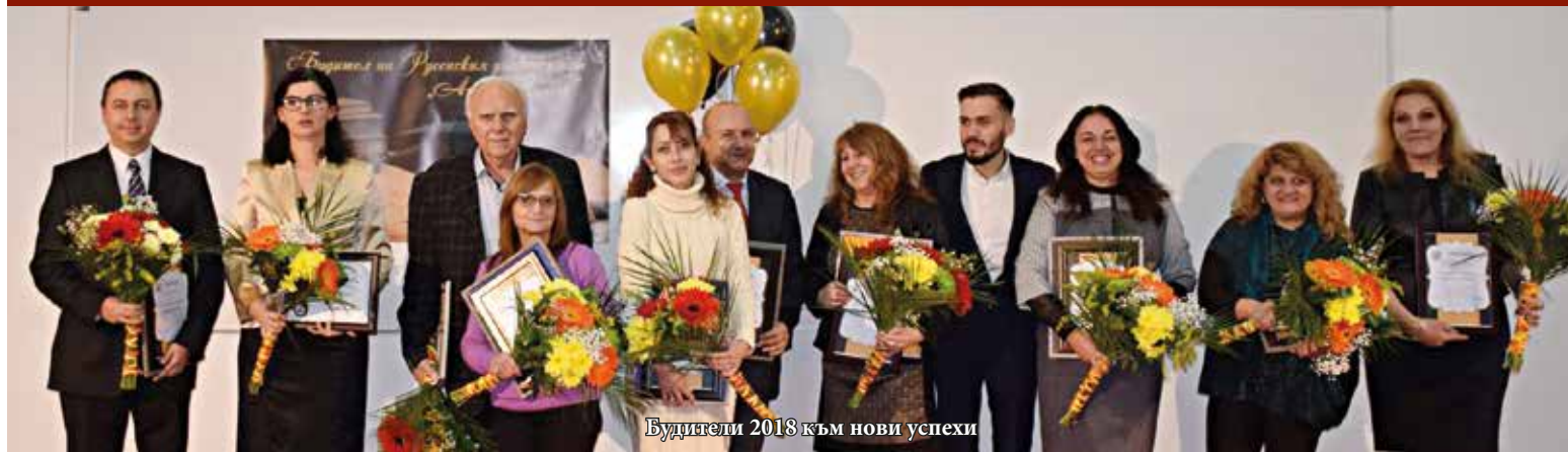
Будители 2018 към нови успехи

На 28 ноември 2018 г. студентите и Студентският съвет от Русенския университет определиха за четвърта поредна година Будителите на Русенския университет 2018 г. В продължение на месец студентите имаха възможност да номинират хората, в които намират най-голямо вдъхновение, и при които усвояват най-пълноценно знанията за професионалното им развитие.