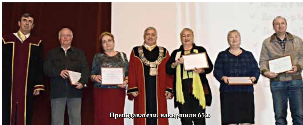
Преподаватели, навършили 65 г.

вдъхновен”, каза в словото си ректорът чл.-кор. проф. Христо Белолев. Той съобщи, че Русенският университет е четвъртият от България, подписал